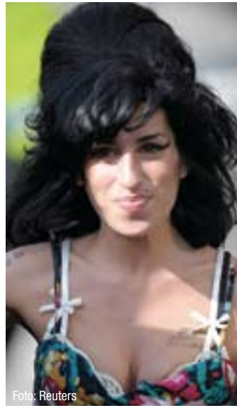
Gegen die Sucht von Amy Winehouse sind die Eltern ratlos.